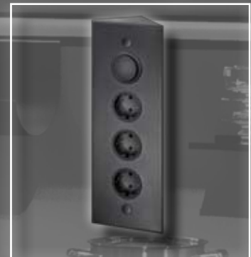
STS 3007 Energie-Ecksäule schwarz ohne Teleskopstück 320 mmx115 mmx58 mm