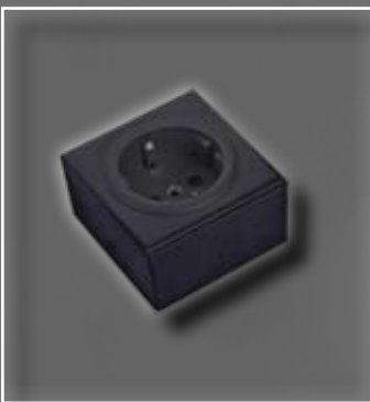
ST 3080 ST/1 schwarz 62x62x41 mm ST 3080 ST/1 black 62x62x41 mm