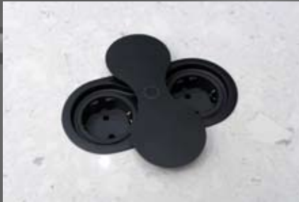
ST 09 schwarz 2-fach Einbausteckdose mit drehbarer Abdeckung L:146 B: 71 mm H:1,2 mm T: 46 mm Für max.39 mm Materialstärke Lochausschnitt: 135 x 60 mm (Bohrschablone) ST 09 black 2 fold build in Socket w/ cover IP20 W:60 L: 146 H: 1,2 mm for max 39 mm material thickness Cut hole: 135x60 mm