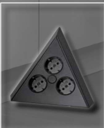
ST 3007/C Ecksteckdose 3-fach schwarz 192 x 155 mm ST 3007/C Corner Socket Element black 192 x 155 mm