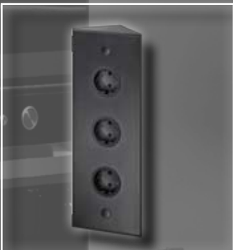
ST 3007/320/3 Energie-Ecksäule schwarz 320 x 115 x 60 mm ohne Teleskopstück ST 3007/320/3 Socket element black L:320 mm x 115 mm x 60 mm