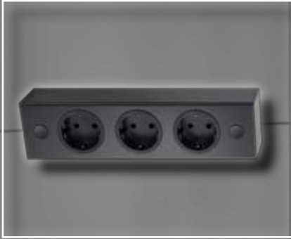
ST 3002 Unterbausteckdose schwarz 240x62x48 mm ST 3002 Socket element black 240x62x48 mm