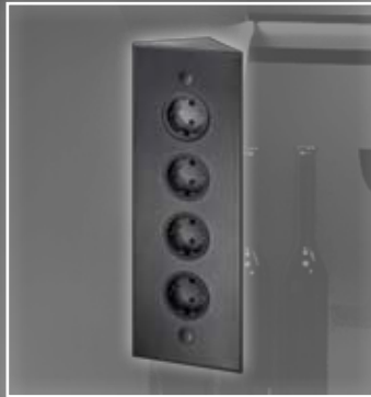
ST 3007/320 Energie-Ecksäule schwarz 320 x 115 x 60 mm ohne Teleskopstück ST 3007/320 Socket element black L:320 x 115 x 60 mm