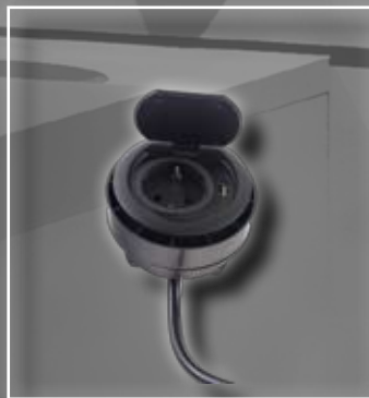
ST 08 USB Schwarz Einbausteckdose mit Klappdeckel 1 x Steckdose 240 V/16 A 3500 Watt IP20 1 x USB Port 5V / 1000 mA B:85 H:2,6 / 68,5 mm Lochausschnitt: 70-74 mm Für Materialstärke bis 45 mm ST 08 USB black build in Socket w/ swivelling cover 1 Socket 240 V/16 A 3500 Watt IP20 1 USB Port 5V / 1000 mA W:85 H:2,6/68,5 mm Cut hole: 70-74 mm For Material thickness up to 45 mm