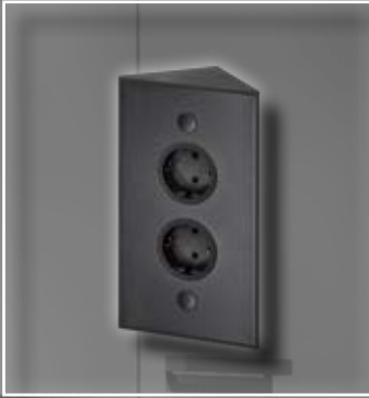
ST 3007/200/2 Energie-Ecksäule schwarz 200 mm ohne Teleskopstück, ST 3007/2 socket corner element black 200 mm