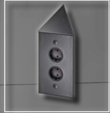
ST 3007/2-C Energie-Ecksäule schwarz 288 mm x 115 mm ST 3007/2-C socket corner element black 288 mm x 115 mm