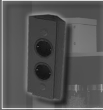
ST 3072/200/2 Energie-Ecksäule schwarz 200 mm ohne Teleskopstück, ST 3007/2 socket corner element black 200 mm